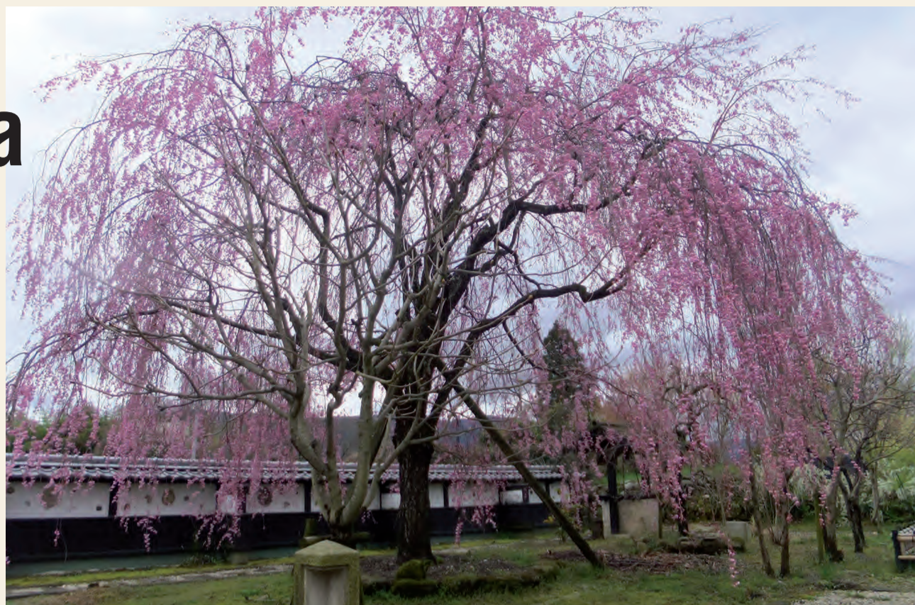
Un magnifico esemplare di ciliegio in fiore evoca di per sé i principi della piena armonia e della bellezza. Senza giungere a tanto anche esperienze di logistica condivisa possono tendere a creare processi armonici apportatori, quali effetti collaterali significativi, di riduzione dei costi e di ottimizzazione

nenti automobilistici e l'altra di vini - hanno gli stabilimenti in zone abbastanza distanti tra loro: una in Germania e l'altra in Piemonte. L'azienda tedesca, d'accordo con quella piemontese, carica vino sui propri veicoli nel viaggio di ritorno in Germania e, viceversa, quella piemontese riempie i suoi mezzi con le scatole di componenti al ritorno in Italia. Nel caso in cui quantità e configurazione dell'imballaggio siano simili, questa è la migliore soluzione al problema dei viaggi a vuoto, con una riduzione notevole dei costi e dell'inquinamento. Allo stesso modo, anche nell'ambito della stessa zona, si possono sfruttare egregiamente gli elementi sinergici della logistica condivisa. Un'azienda che produce beni per la casa, di uso quotidiano, riforniva direttamente i vari grossisti in Italia settentrionale. Agendo da sola aveva già ottimizzato al massimo le sue consegne e non riusciva a trovare nuove idee per un'ulteriore riduzione dei costi. In collaborazione con un'azienda che fabbrica detersivi e detergenti, e con cui ha pochi prodotti in comune che si fanno concorrenza, ha coinvolto altre aziende e insieme hanno realizzato un unico centro per le consegne. Da questo centro ora avvengono congiuntamente le consegne verso i grossisti. In questo modo la merce di più produttori viene caricata sul medesimo veicolo e la consegna viene fatta tutta in una volta. C'è