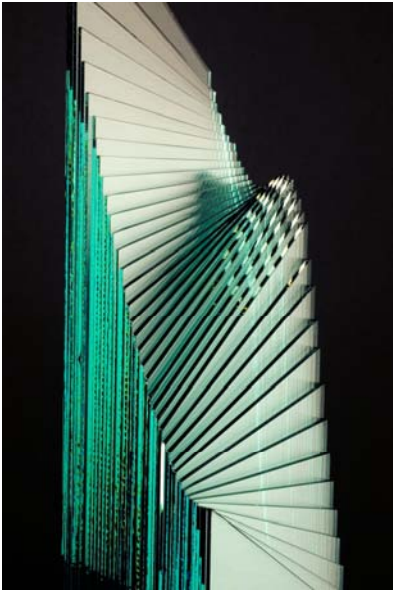
Water Signal , 2001 (dettaglio) glass/iron, 65,0x55,0x173,0 h cm

IZUMI ŌKI. Nata a Tokyo, Si è laureata in letteratura giapponese antica all'Università Waseda di Tokyo, ha studiato pittura e scultura con Aiko Miyawaki, Taku Iwasaki e Yoshishige Saito. Ottenuta nel 1977 una borsa di studio per la scultura dal Governo Italiano si diploma nel 1981 all'Accademia di Belle Arti di Brera, nel corso di scultura di Giancarlo Marchese. Ha partecipato con sue opere e installazioni alla Biennale di Venezia nel 1985 (Progetto Venezia, Terza mostra internazionale di architettura) e nel 1986 (Arte e Biologia, XLII Biennale Internazionale di Arti Visive); alla Triennale di Milano nel 1983; al Museum of Modern Art of Hokkaido a Sapporo (Giappone) nel 1991; nel 1992 alla Galleria d'Arte Moderna di Roma, nel 1997 all'Istituto Giapponese di Cultura a Roma (Confini). Con Paola Levi Montalcini ha esposto in Arte delle muse nel 1998 presso lo stesso Istituto Giapponese di Cultura. Nel 2007 ha tenuto una mostra antologica al Museo Civico di Lubiana (Slovenia). Sue opere si trovano anche nel Magazzino privato del Vaticano.