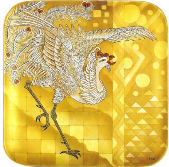
Uccello del Paradiso, 2000 29 x 29 cm Collezione Privata