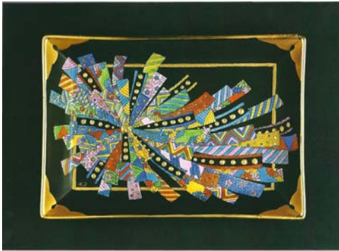
Svuotatasche 2000 18 x 25 cm Collezione Privata

IKO ITSUKI. Vive in Italia da trenta anni. Per molti anni ha lavorato a Firenze presso l'atelier di Emilio Pucci. Dalla collaborazione con questo straordinario creatore di moda nasce la scoperta appassionante e l'apprendimento dell'arte della combinazione dei colori. In seguito lavora come designer di tessuti presso la Contessa Di Colbertaldo a Roma. L'esperienza nel settore della moda viene quindi utilizzata e trasmessa nella pittura su porcellana. Iko Itsuki Damiani ha tenuto mostre in Italia e in Giappone e molte dimostrazioni di tecniche pittoriche su porcellana. Per tre anni ha fatto parte della giuria del Concorso Internazionale di Decorazione su Porcellana a Tokyo. E' diplomata presso l'IPAT (International Porcelain Artists and Teachers) come insegnante di pittura su porcellana. Attualmente vive e lavora a Roma.