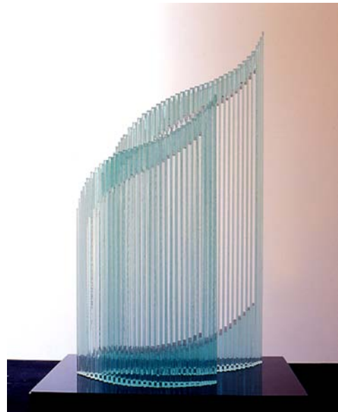
Instrument for Listening the Light , 2003 glass/granite, 40,0x30,0x59,0 h cm